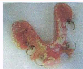
清掃不良の入れ歯